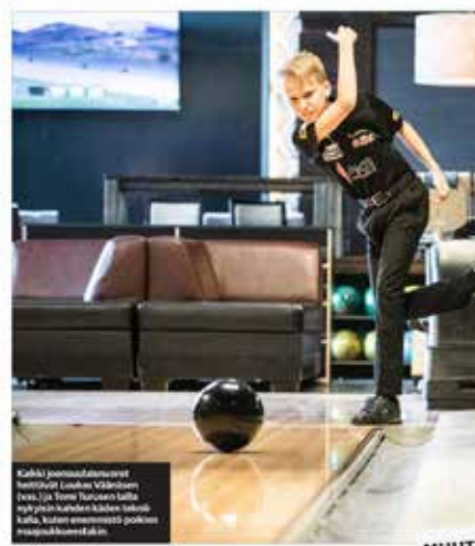
Kahdeksan parhaan muksiseissä kaatovire löytyi sitten toden teolla ja vain kaksi vastustajaa pystyi kaatamaan joensuulaisen.